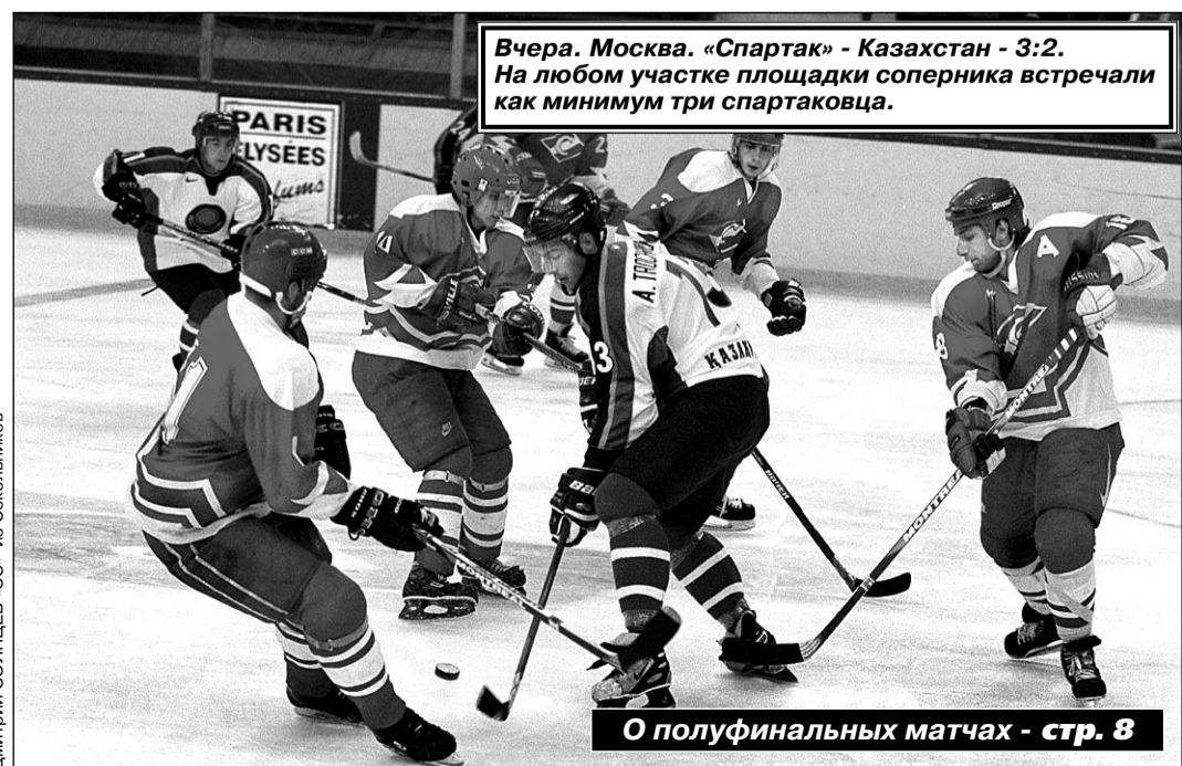
Вчера. Москва. «Спартак» - Казахстан - 3:2. На любом участке площадки соперника встречали как минимум три спартаковца.