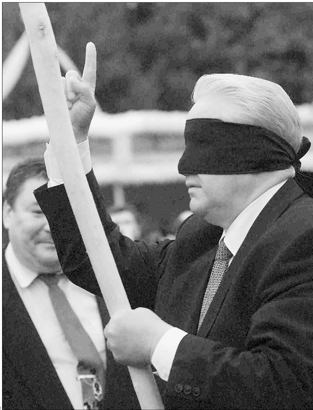
Борис Ельцин. Зримый выбор

Может быть, он нас не заслужил; зато мы его — заслужили.