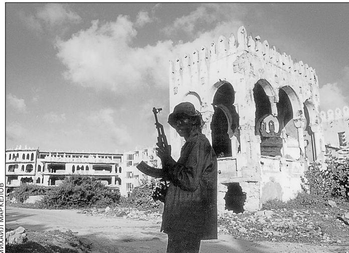
Сомали: «человек с ружьем» вместо государства

Далеко не все школы и больницы войдут в состав «Российских железных дорог» (РЖД) — структуры, которая вберет в себя имущество МПС после разделения хозяйственной и регулирующей функций министерства. Для тех, кто не попадет в РЖД, разработаны иные механизмы финансирования. В частности, к дотированию медицинских и образовательных объектов МПС намерено привлечь регионы.