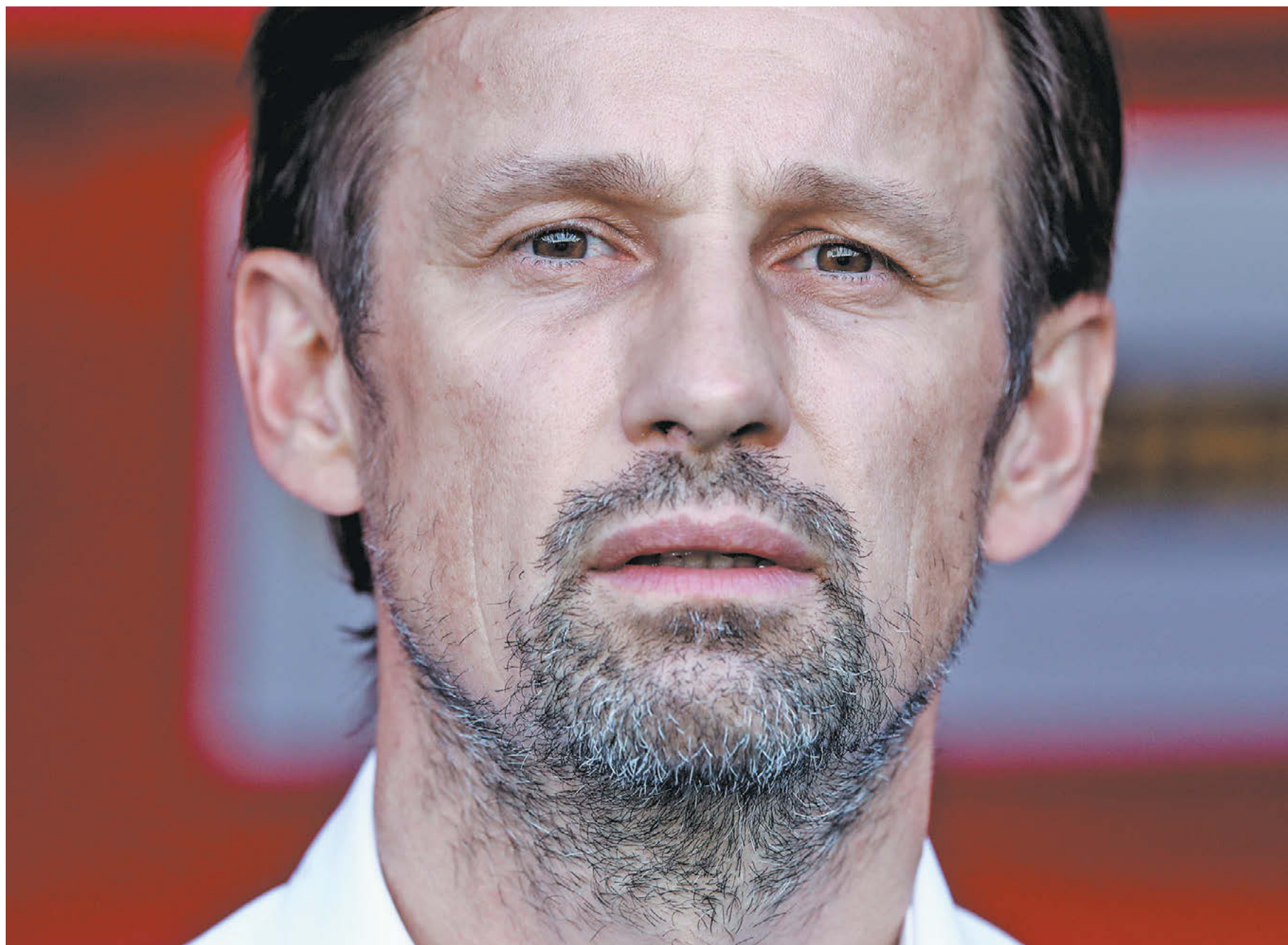
Главный тренер «Зенита» Сергей Семак

Большое интервью главного тренера «Зенита», с которым он выиграл четыре чемпионских титула подряд