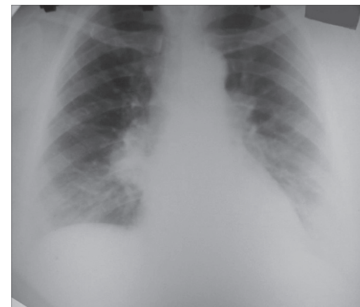
Рис. 2. Рентгенограмма органов грудной клетки больной с благоприятным течением саркоидоза (объяснения в тексте).