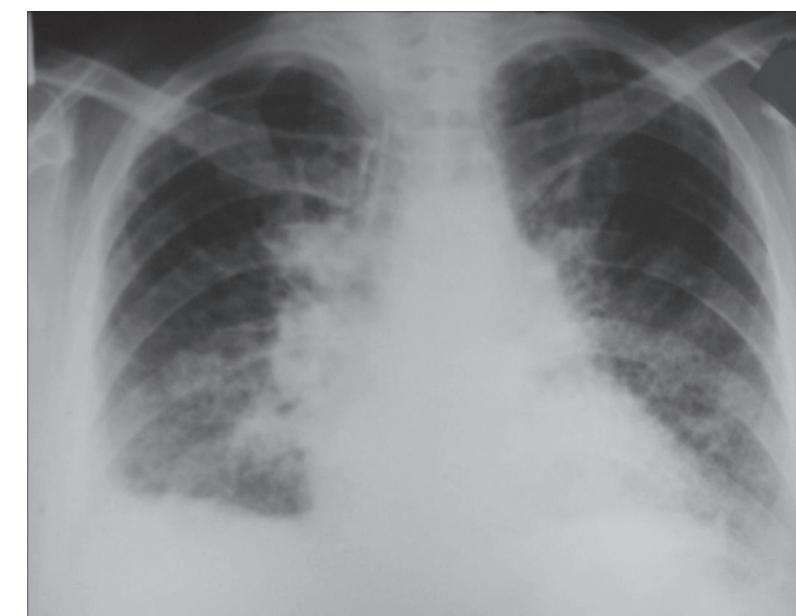
Рис. 3. Рентгенограмма органов грудной клетки больной с неблагоприятным течением саркоидоза. Выраженный фиброз базальных отделов, увеличение ВГЛУ.