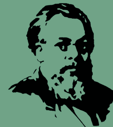
С. П. Боткин