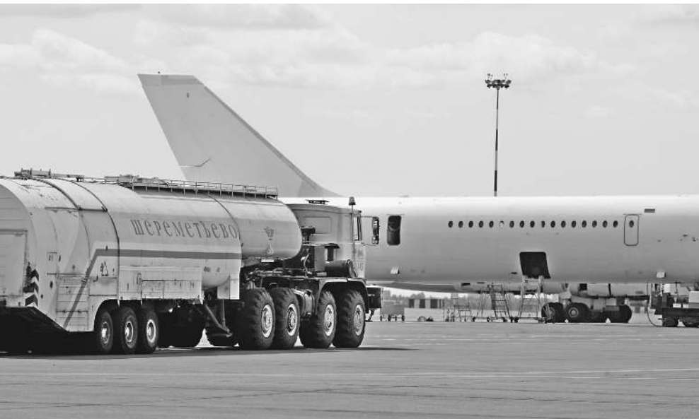
ОАО «Международный аэропорт Шереметьево» намерено в 2012 году выйти из капитала ЗАО «Топливозаправочный комплекс Шереметьево». И это не единственная предстоящая продажа