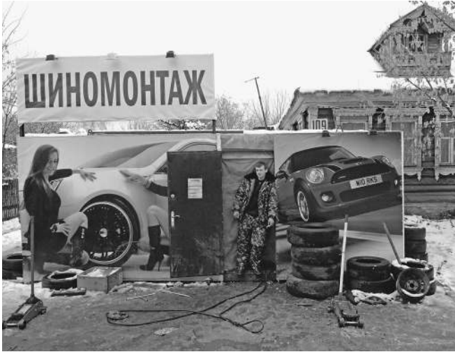
Финансовая ситуация в малом бизнесе не изменится еще 6 лет