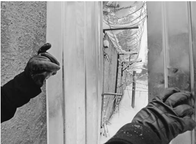
Охранные сооружения только на первый взгляд казались неприступными

Управляющая «Энергомашем» ракетно-космическая корпорация «Энергия» пока забор не починила. 16 января корреспонденты «Известий» обошли периметр предприятия и нашли массу прорех, по-прежнему позволяющих беспрепятствен-