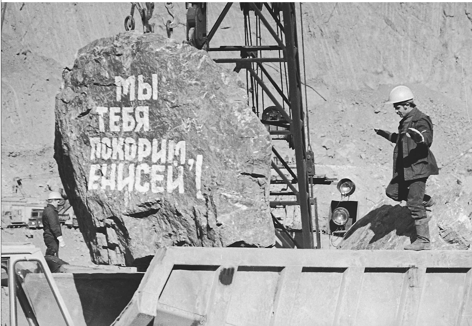
ФОТО: ВИКТОР АЛДОВ «ИЗВЕСТИЯ», 1975 ГОД

Руководители Саяно-Шушенской ГЭС выиграли тендер на ее ремонт, залатали как умели и сами себе заплатили