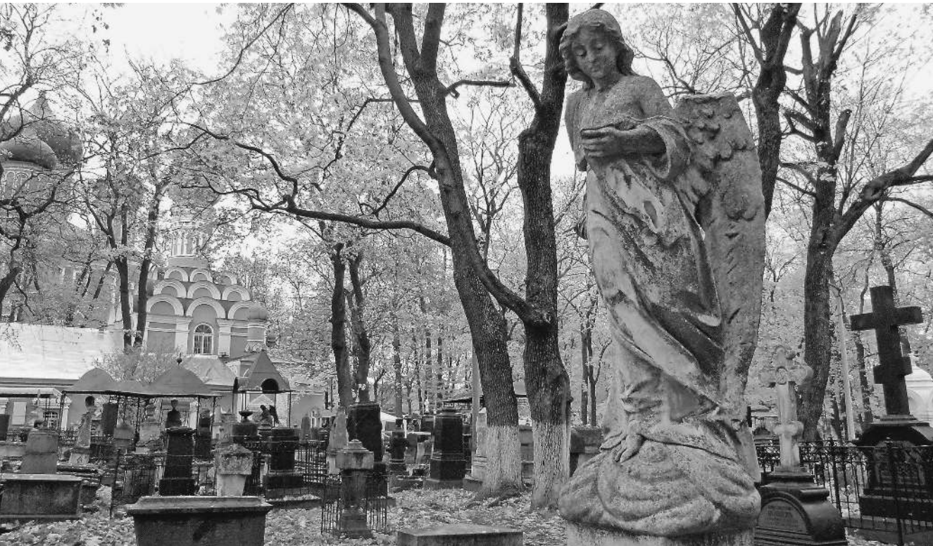
Федеральная антимонопольная служба представила проект поправок в закон «О погребении», которые ограничат гражданам возможность выбора мест на муниципальных погостах