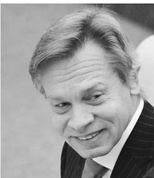
Глава комитета будет представлять Россию вместо думского спикера