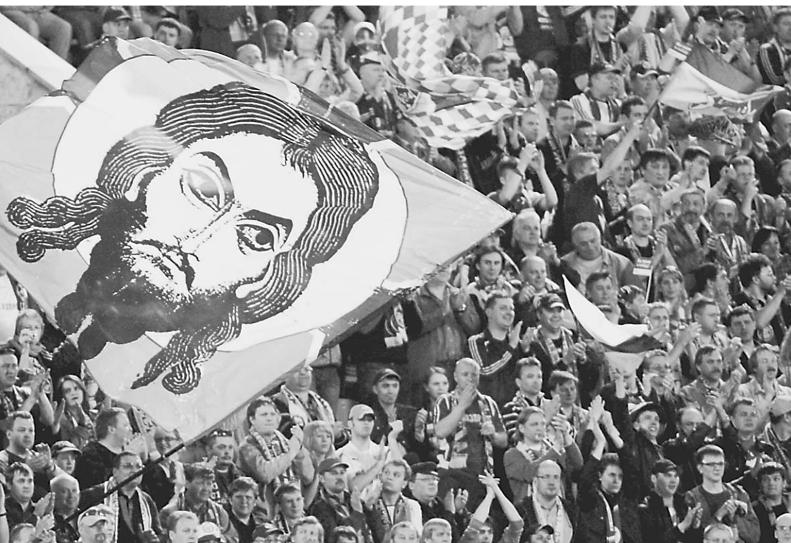
Поклонники «Зенита» готовы развернуть в Манчестере «невский фронт»