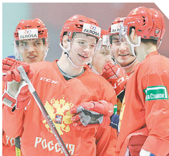
Дарья Исаева «СЭ» / Canon EOS-1D X Mark II