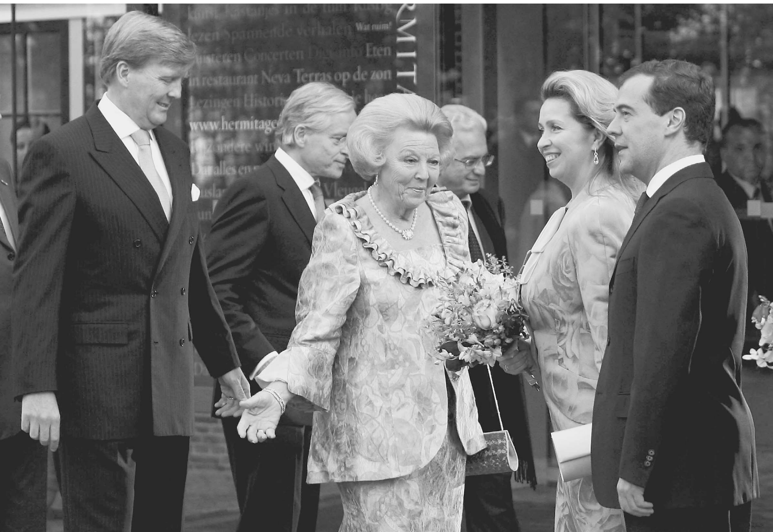
Прежде чем заняться вопросами безопасности, ДМИТРИЙ МЕДВЕДЕВ налаживал культурные связи. Вместе с супругой СВЕТЛАНой , королевой Нидерландов БЕАТРИКС и ее сыном принцем ВИЛЛЕМОМ-АЛЕКСАНДРОМ (слева), президент открыл филиал российского Эрмитажа в Амстердаме

Москва предлагает увязать договор о СНВ с размещением американской ПРО в Европе