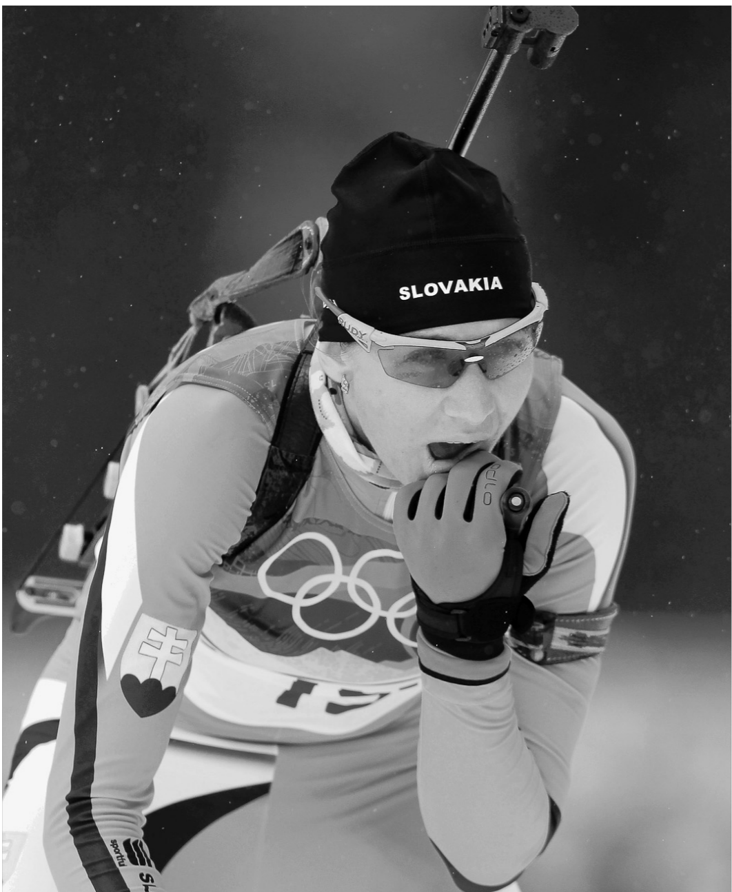
Суббота. Уистлер. Видим - КУЗЬМИНА, читаем - SLOVAKIA.

В субботу наша соотечественница Анастасия Кузьмина, выступающая ныне за Словакию, стала олимпийской чемпионкой в спринте