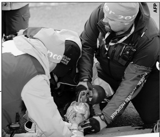
Пятница. Уистлер. Попытки спасти Нодари КУМАРИТАШВИЛИ оказались тщетными.

О трагической гибели грузинского саночника Нодари Кумариташвили - стр. 14