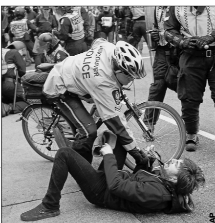
Суббота. Ванкувер. Канадские полицейские усмиряют манифестантов.

О столкновениях канадской полиции с протестующими в Ванкувере - стр. 13