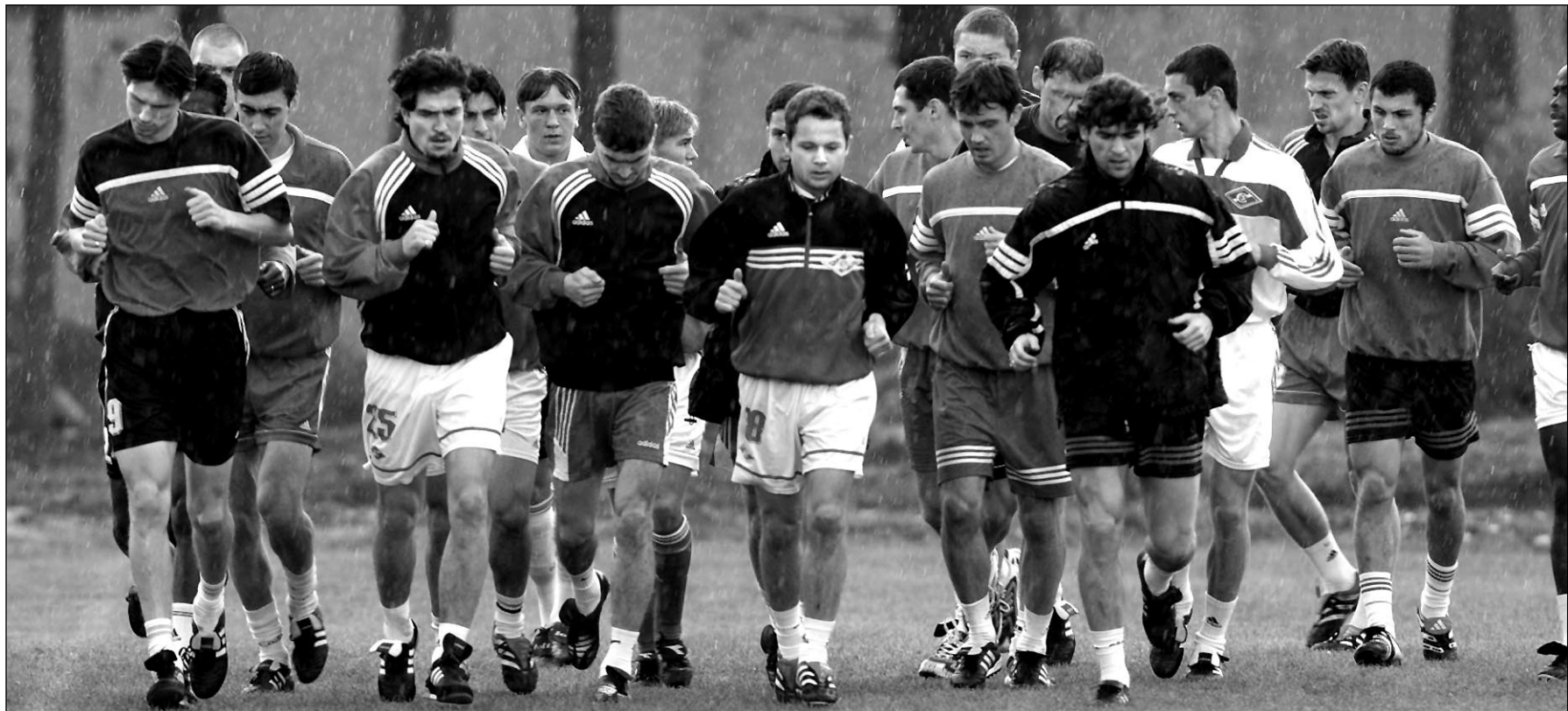
Вчера. Тарасовка. Тренировка «Спартак». Последнее перед матчем с «Крыльями» занятие чемпионов из-за града оказалось необычно коротким.

А разве есть в нашем чемпионате команда высокого уровня, в которой бы не играли бывшие игроки «Спартак»? - задал Романцев вполне риторический вопрос.