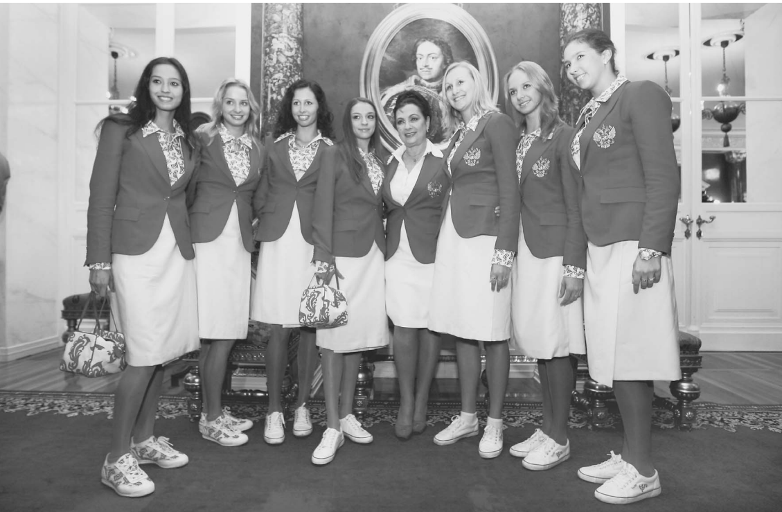
Ирина Винер вместе с ученицами, чемпионками Олимпийских игр в Пекине (слева от тренера — победительница индивидуальных соревнований Евгения Канаева)