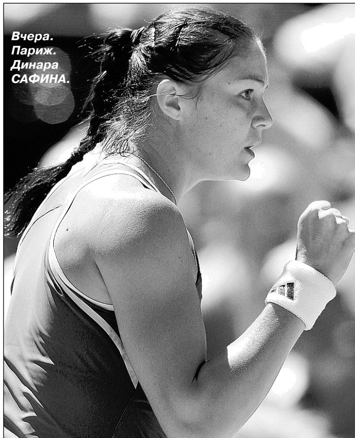
Вчера. Париж. Динара САФИНА.