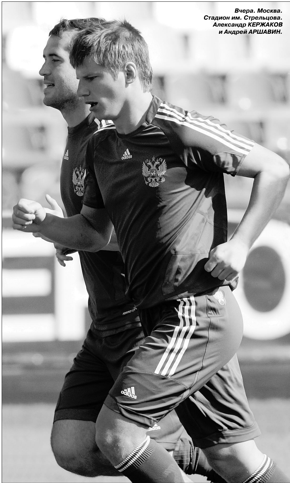
Вчера. Москва. Стадион им. Стрельцова. Александр КЕРЖАКОВ и Андрей АРШАВИН.