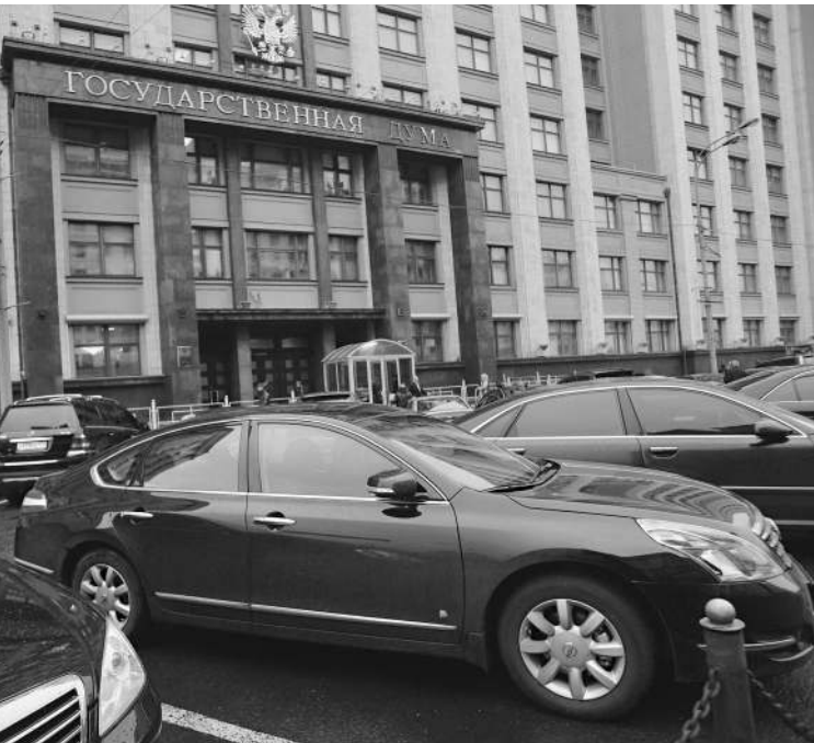
Несмотря на забастовку, водители без опозданий доставили депутатов к стенам Госдумы, где вчера проходило сразу несколько мероприятий

В отличие от политиков работники вышли к журналистам с документами в руках, демонстрируя под фото- и телекамеры уведомления об изменении трудового договора: дескать, дорогие друзья, с 1 января 2010 года мы вам будем платить по 50 рублей за один час работы, не согласны — никто не держит. → СТР. 3