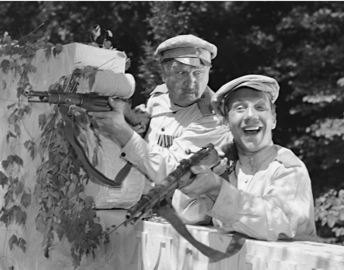
В фильме «Новые приключения неужуковых». 1968 год

Недавно Россия отметила 75-летие Савелия Крамарова. Без него, но с искренним душевным пафосом. Вряд ли эту дату припомнил хоть кто-нибудь в Голливуде, куда Крамаров прибыл в 1982-м. → СТР. 10