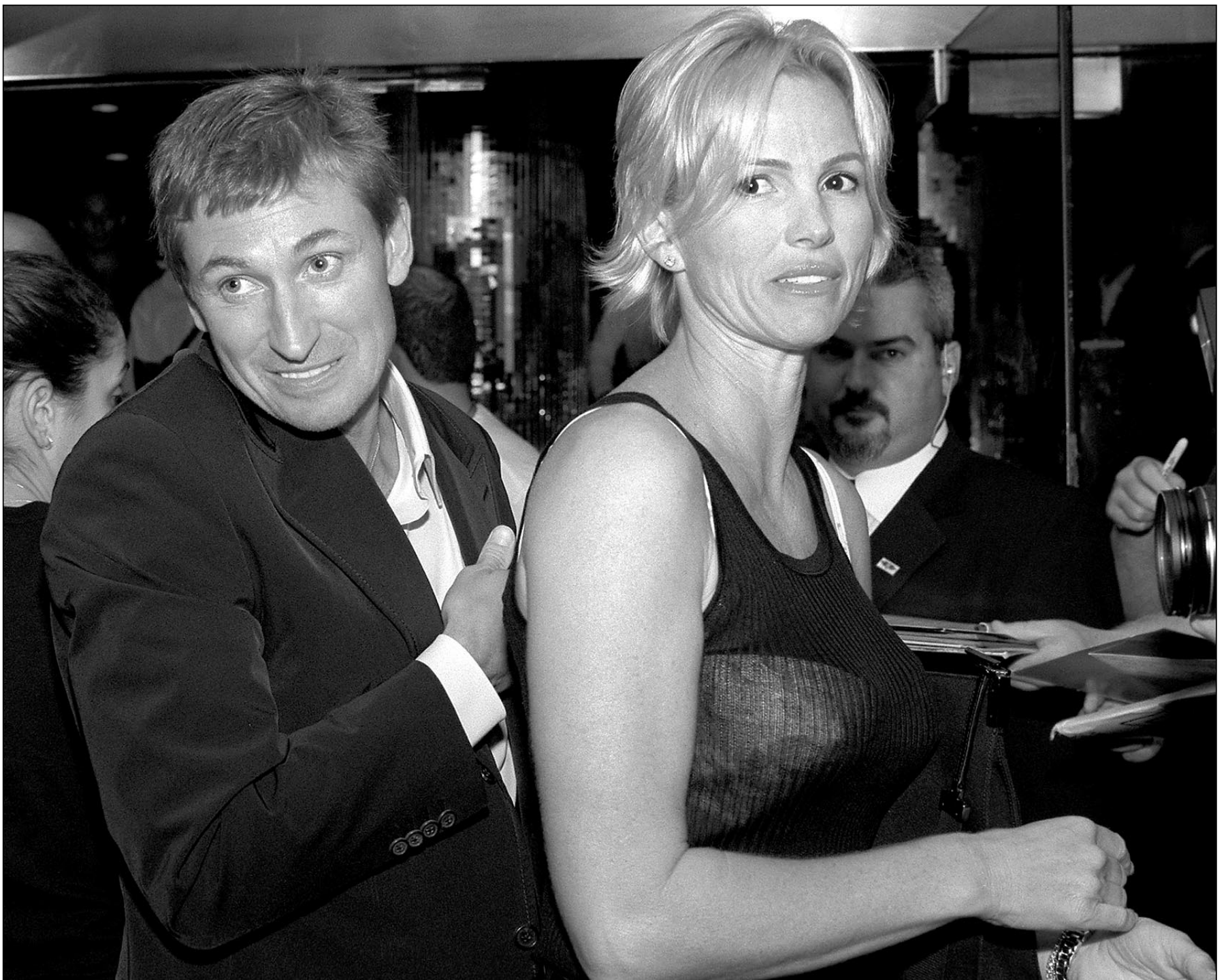
Уэйн ГРЕТЦКИ и его супруга Джанет оказались в центре скандала и попали в щекотливую ситуацию.