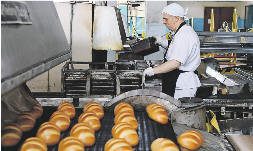
В 100 г наиболее популярного у россиян нарезного батона содержится 1,1 г соли, что выше необходимой нормы

На прилавках появится хлеб с пониженным содержанием соли