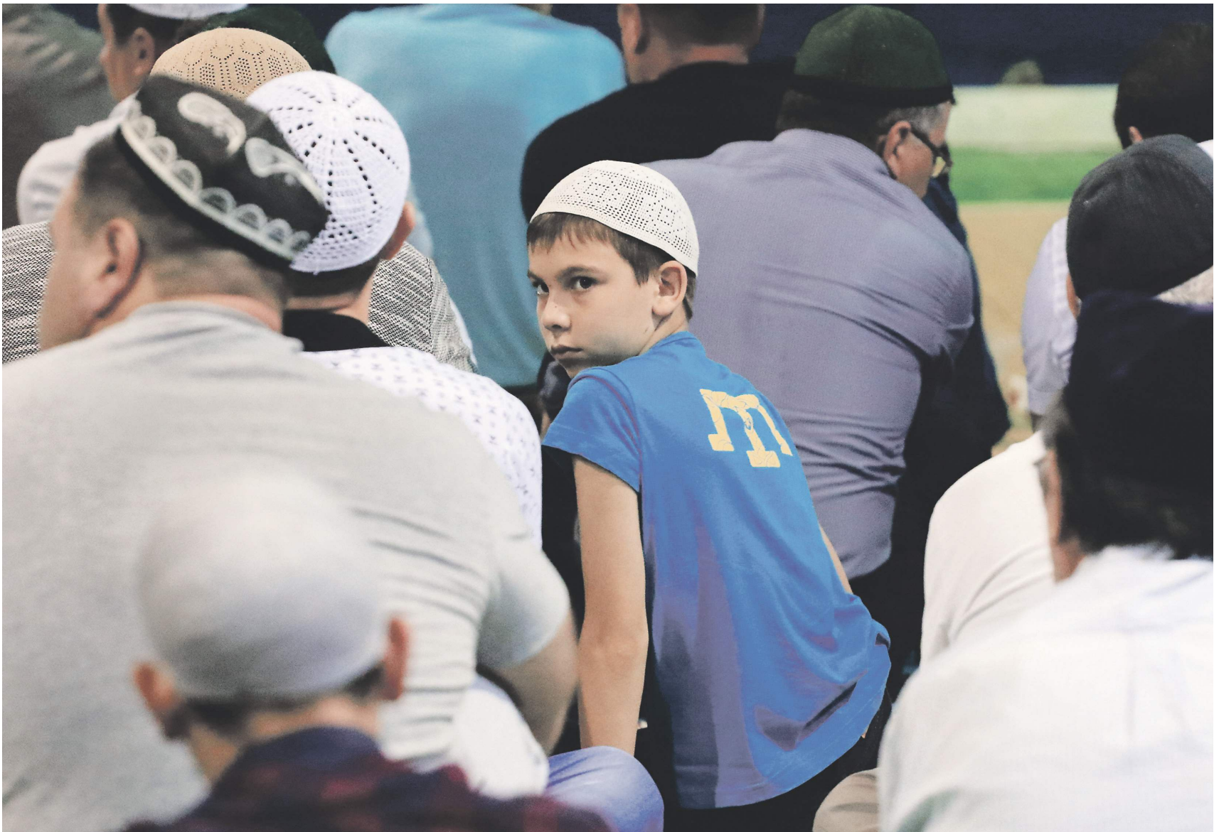
Крымские татары — самая многочисленная группа мусульман в Крыму

— Конечно, понятно, что визы они получили в Москве, — заявили