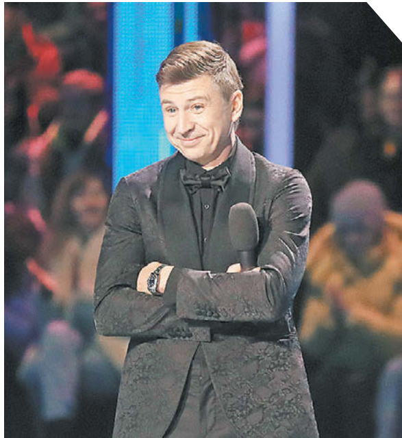
Федор Успенский «СЭ»