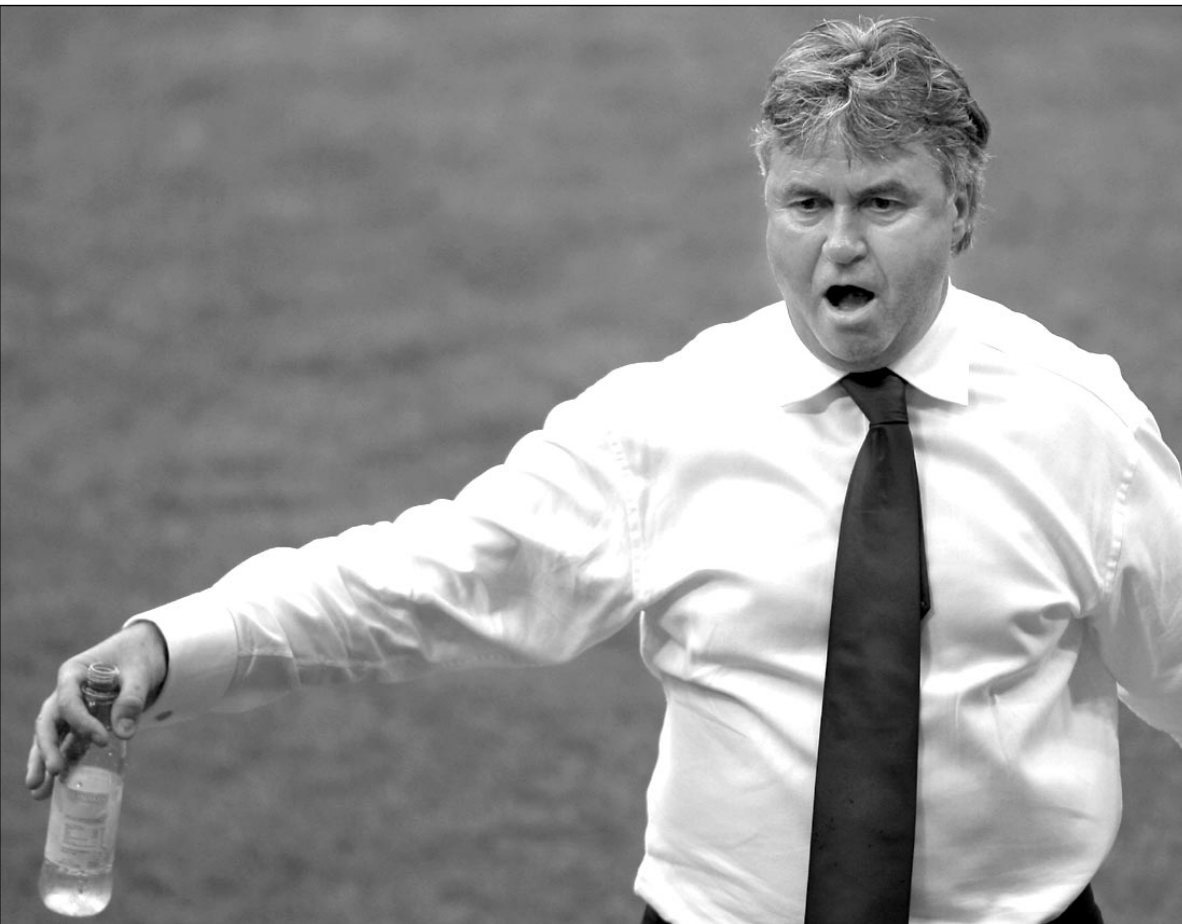
Понедельник. Мюнхен. Бразилия - Австралия - 2:0. Главный тренер австралийцев Гус ХИДДИНК.

И работать придется, господа футболисты сборной России! Перед чемпионатом мы три недели выкалывали как проклятые, - говорил мне на днях защитник «Блэкберна» и австралийский сборной Хиддинка, главный тренер «Тоттенхэма» Мартин Йол говорит: «Как и хиддинковская Корея четыре года назад, Австралия выглядит потрясающе готовой физически. Получив работу на этом континенте, Хиддинк тут же взял к себе лучшего в Голландии тренера по физподготовке. В результате