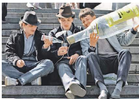
Владимир ВЕЛЕНУРИН/«КП» - Москва