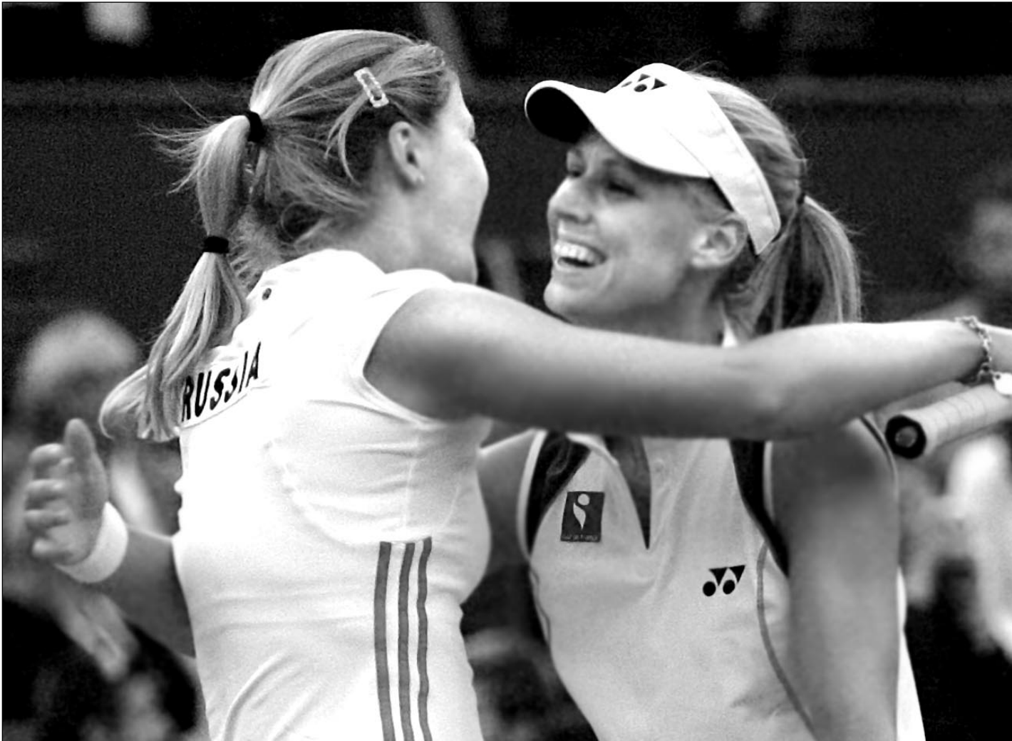
Воскресенье. Париж. Динара САФИНА (слева) и Елена ДЕМЕНТЬЕВА празднуют победу.