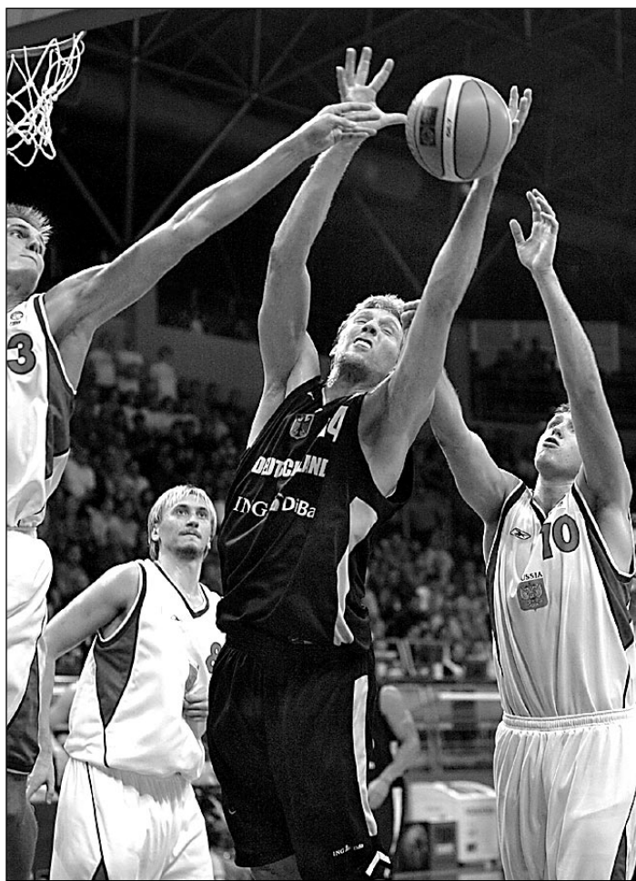
Воскресенье. Вршац. Россия - Германия - 50:51. Защита сборной России в действии: Андрей КИРИЛЕНКО, Никита МОРГУНОВ и Виктор ХРЯПА (слева направо) обыгрывают под чужим щитом Дирка НОВИЦКИ.

В ночь с воскресенья на понедельник по московскому времени на ЧЕ-2005 в Сербии и Черногории завершился групповой турнир. Сборная России в последнем туре уступила Германии - 50:51. Наши показали хороший баскетбол и почти всю игру лидировали в счете - до тех пор, пока знаменитый Дирк Новицки не забросил на последних секундах решающий трехочковый. Тем не менее россияне заняли 1-е место в группе, опередив немцев, а также вице-чемпионов Олимпиады-2004 итальянцев, и вышли сразу в четвертьфинал. Их соперник определится сегодня - им станет победитель встречи 1/8 финала Греция - Израиль.