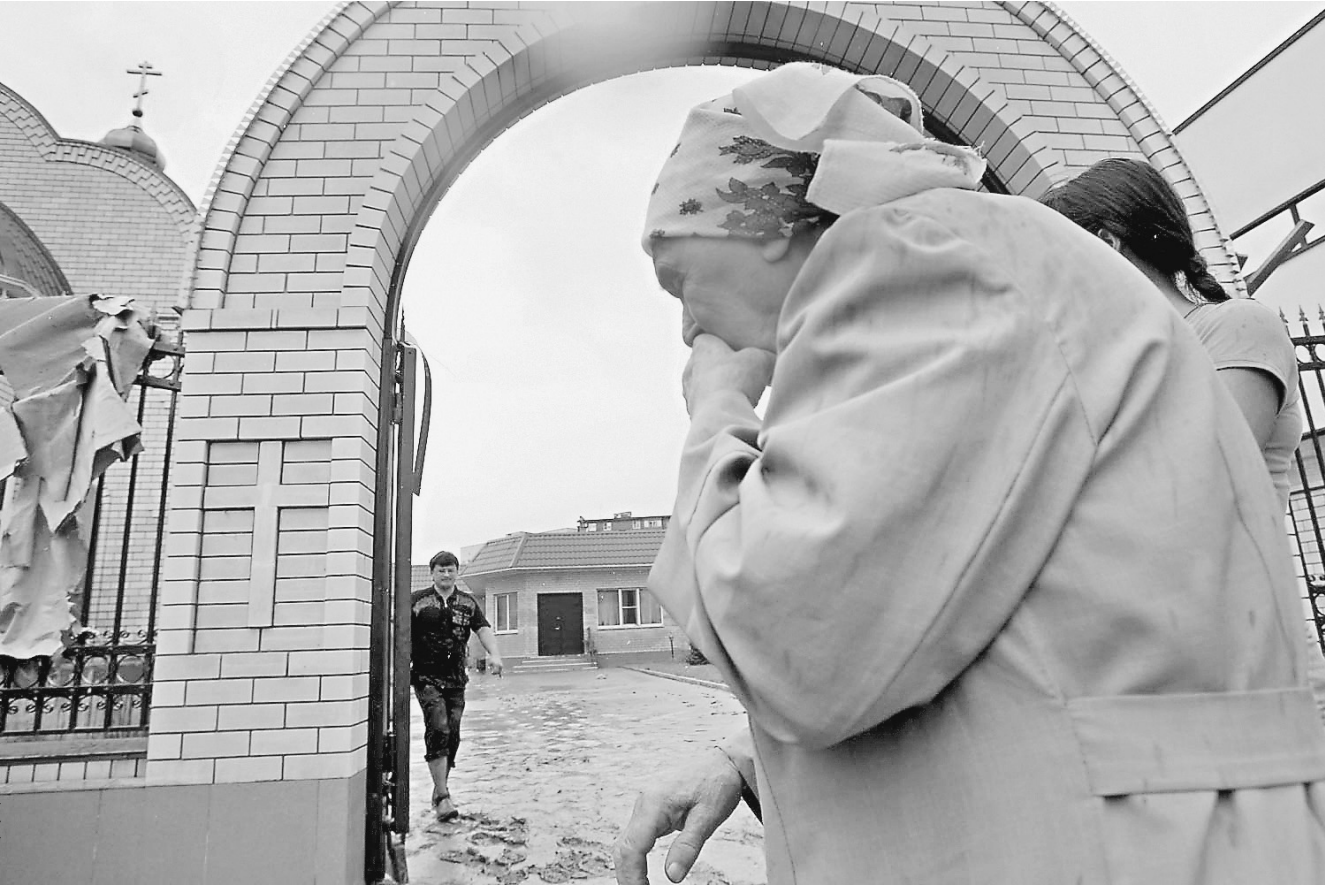
В церкви можно найти утешение, но не защиту