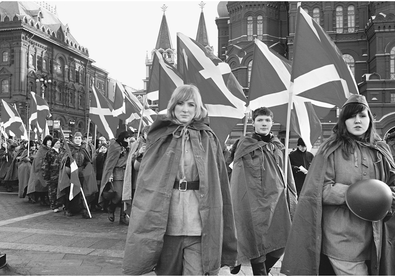
Костюмированные представления — наиболее запомнившиеся мероприятия «нашистов»