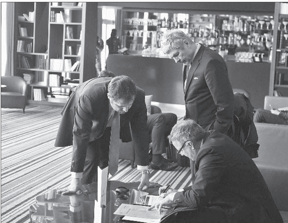
Вчера. Рюэй-Мальмезон. Офицеры ВАДА в отеле, где остановилась сборная России.