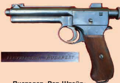
Пистолет «Рот-Штейн» образца 1907 г.