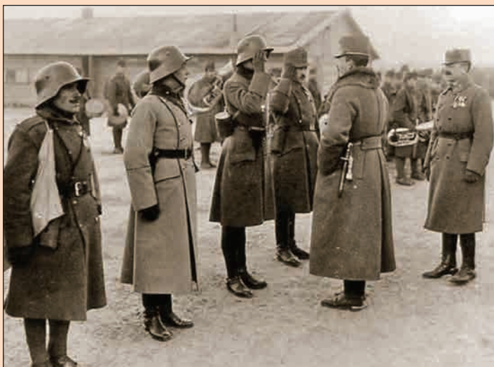
Солдаты австро-венгерской штурмовой роты и император Карл

В области организации и обучения этих войск командирам была предоставлена почти безграничная власть. И к 1918 году австрийские штурмовые части стали элитой вооружённых сил как по подбору кадров, так и по вооружению и оснащению.