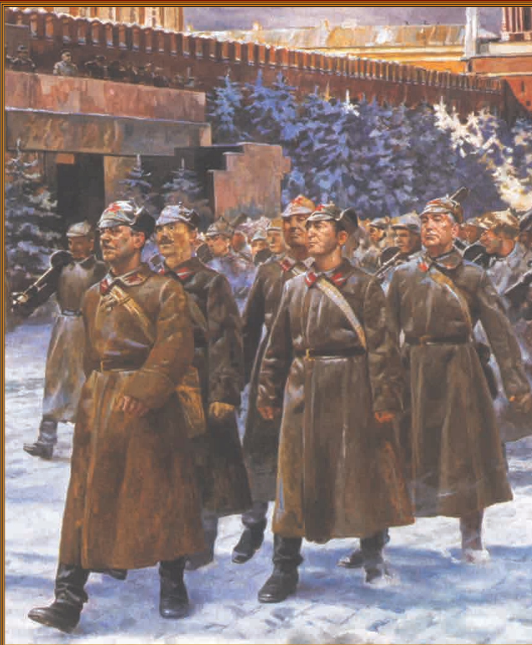
Парад 1941 года Художник А.М. Самсонов, 2004 г.

7 ноября — проведение военного парада на Красной площади в честь 24-й годовщины Октябрьской революции. День воинской славы России