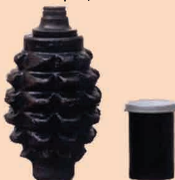
Тяжёлая ручная граната Schwerhandgranate