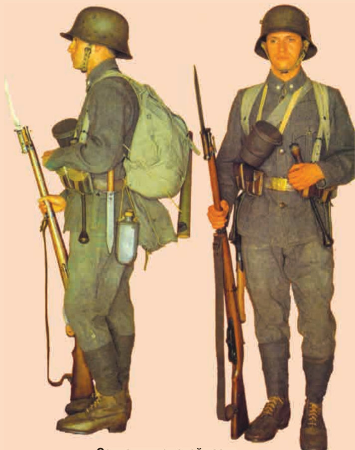
Солдат штурмовой части в полном снаряжении Итальянский фронт, 1917 г.

Более подробно о составе штурмовых подразделений, их амуниции и вооружении, а также целях и задачах в бою читайте в статье А.В. Олейникова «Организация, вооружение и тактика австро-венгерских штурмовых частей в годы Первой мировой войны».