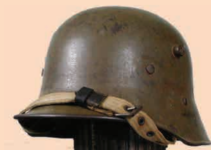
Австро-венгерский стальной шлем модели 1917 года, также называемый «немецкая модель»