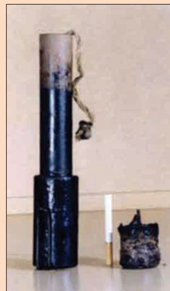
▲ Граната Rohrhandgranate