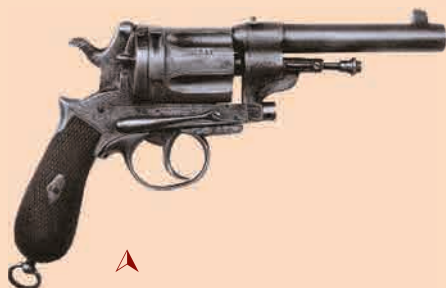
▲ Револьвер Гассера