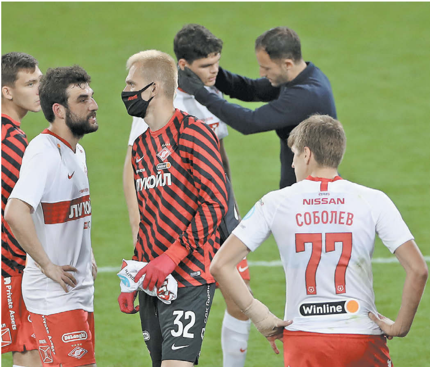
Вторник. Москва. ЦСКА – «Спартак» – 2:0. Спартаковцы после финального свистка