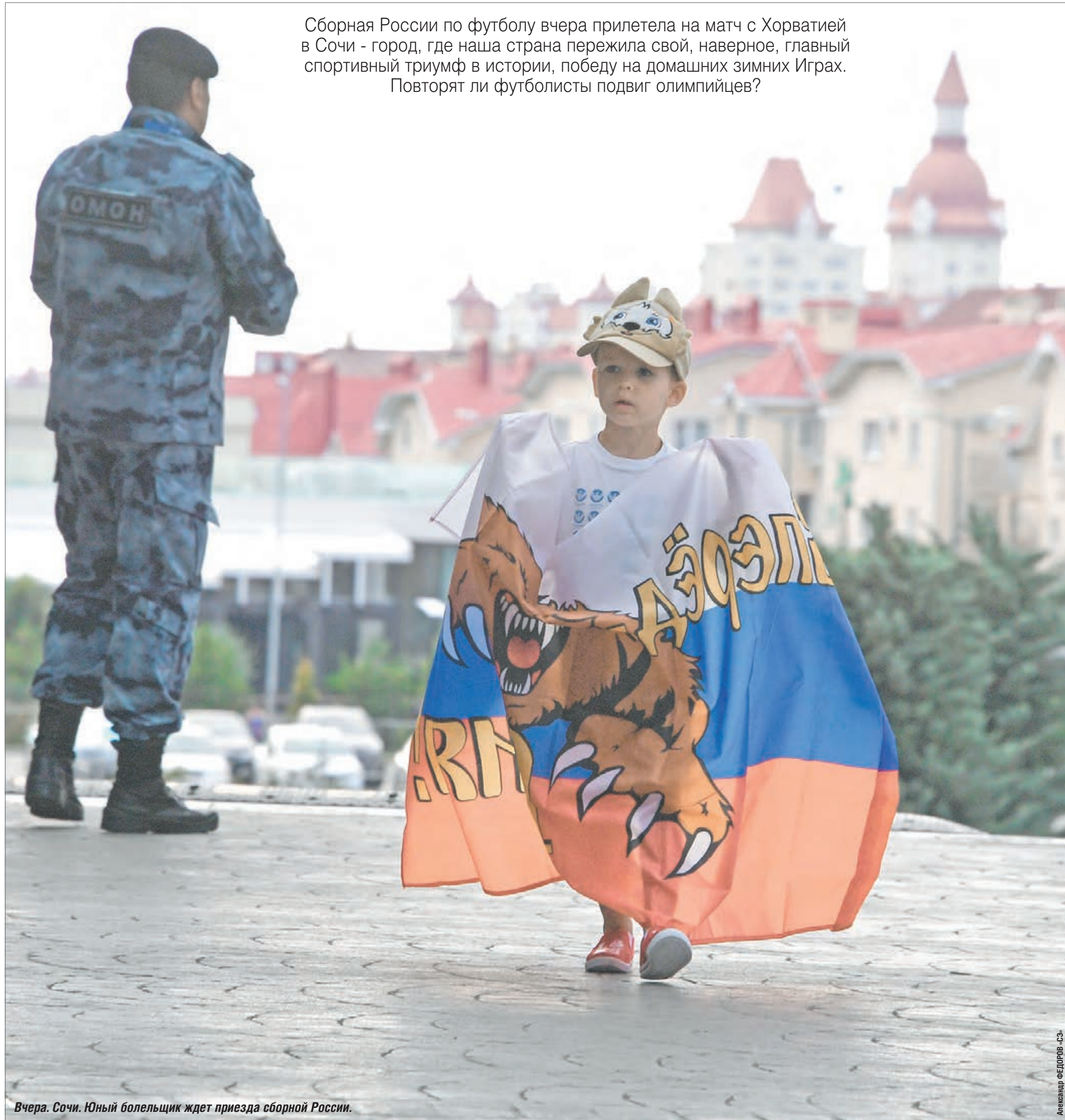
Вчера. Сочи. Юный болельщик ждет приезда сборной России.

Сборная России по футболу вчера прилетела на матч с Хорватией в Сочи - город, где наша страна пережила свой, наверное, главный спортивный триумф в истории, победу на домашних зимних Играх. Повторят ли футболисты подвиг олимпийцев?