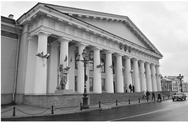
У Петербургского горного института — самый богатый руководитель