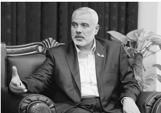
Премьер-министр правительства «Хамаса» в Газе рассчитывает на освобождение всех палестинцев из тюрем Израиля

— На улицах Палестины огромная радость в связи с обменом Шалита на заключенных. Во-первых, это радость по поводу видимого единства палестинского народа. Ведь вышедшие из израильских тюрем представляют практически все палестинские группировки, партии и движения — и мусульмане, и коммунисты. Во-вторых, это освобождение ис-