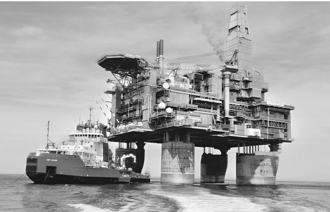
Счетная палата отчиталась об итогах плановой проверки эффективности работы государства и компаний-операторов по реализации действующих соглашений о разделе продукции