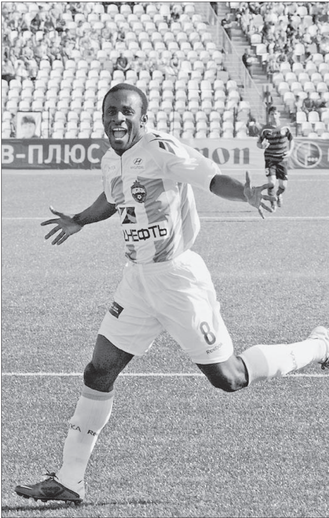
Вчера. Пермь. «Амкар» - ЦСКА - 0:2. Автор дубля Сейду ДУМБЬЯ.

Вчера завершилась первая часть российского футбольного чемпионата, и команды ушли на летний перерыв. Первые матчи 17-го тура состоятся 23 июля.