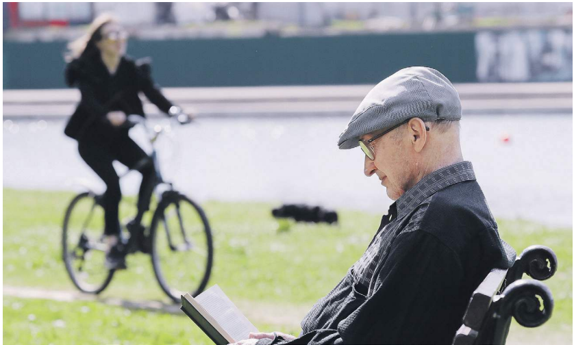
Государство хочет стимулировать граждан создавать «длинные» сбережения смолоду