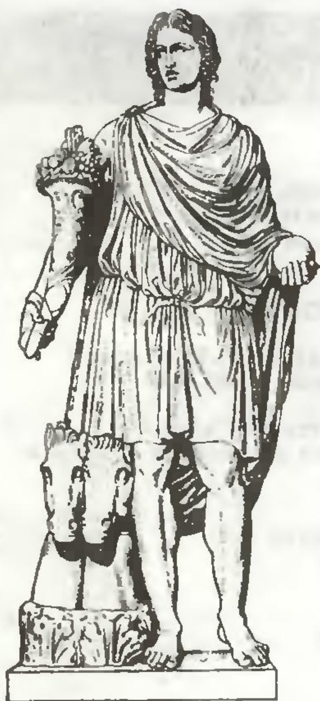
Гелиос (Солнце). С античной статуи (102)