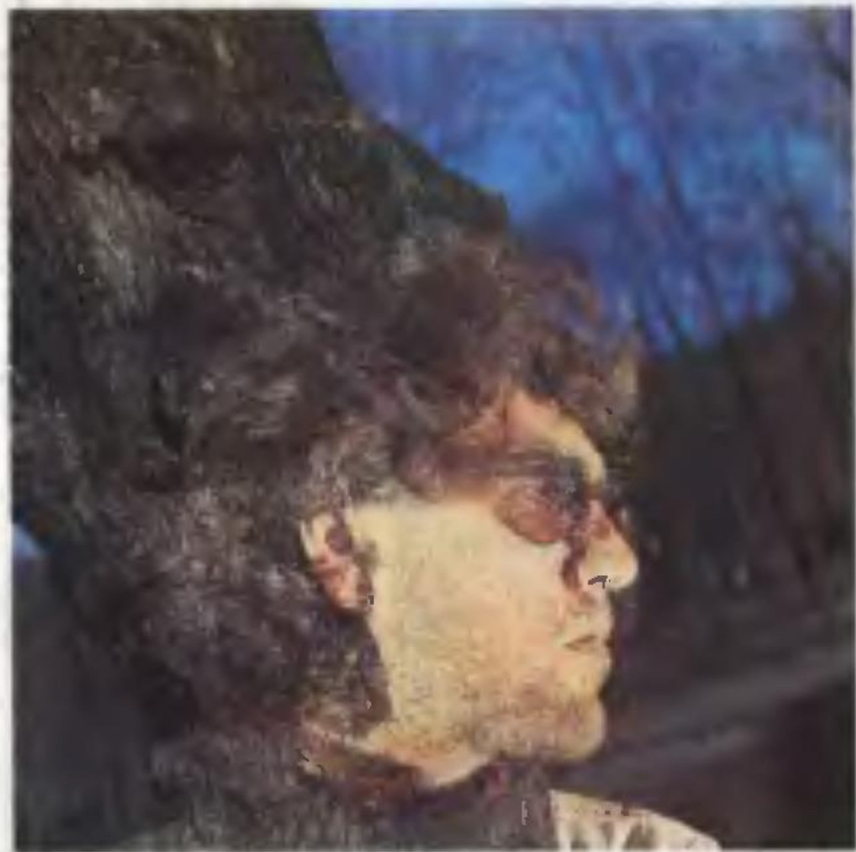
Композиция В. Бреля (121)