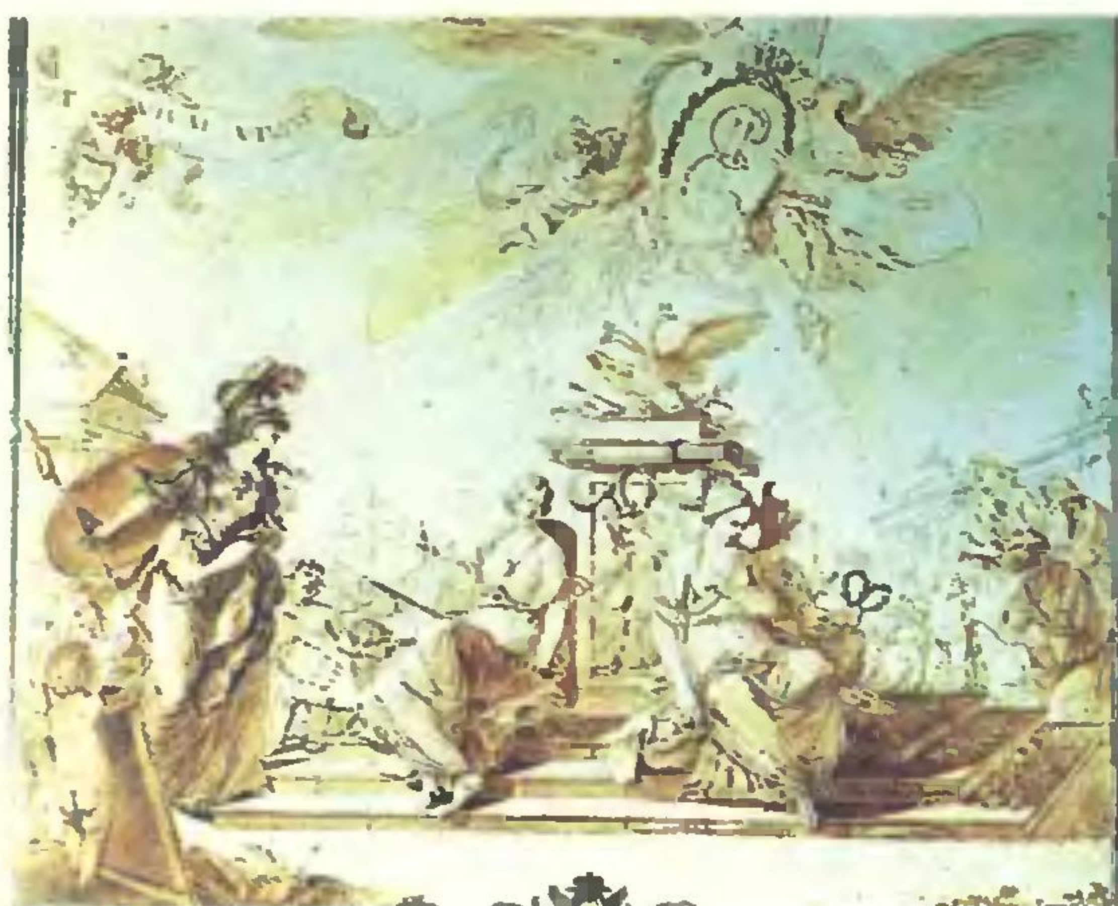
И. Еремеев. «Благоденствие России». Аллегория. 1773 год

На нашей обложке Более четырех тысяч лет женщины занимаются наукой