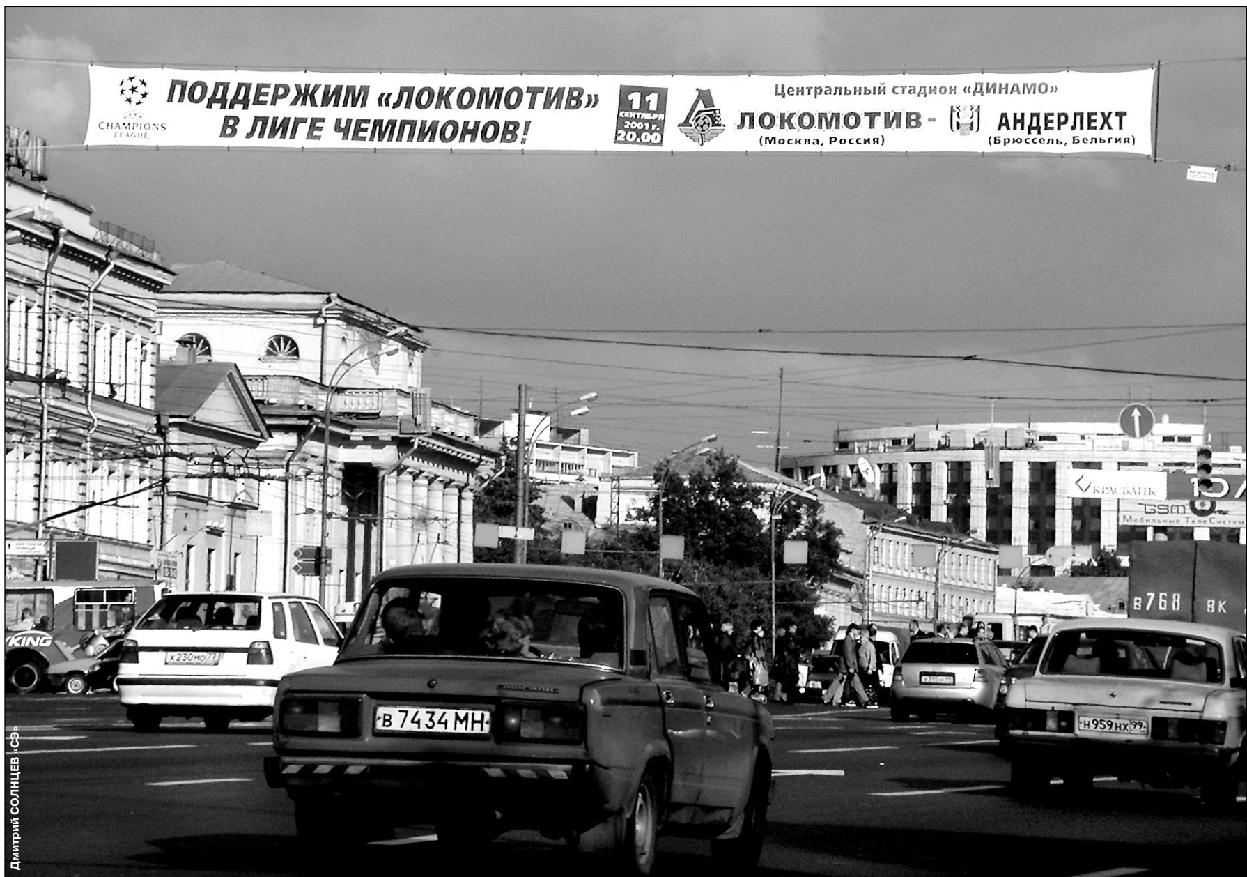
Вчера. Москва. Сухарева площадь. В столице и во всей России верят, что в групповом турнире Лиги чемпионов будет играть «Локомотив», а не «Тироль».

Сегодня это должен сделать «Локо». И если есть в жизни высшая справедливость, он пройдет «Тироль». Не может не пройти.