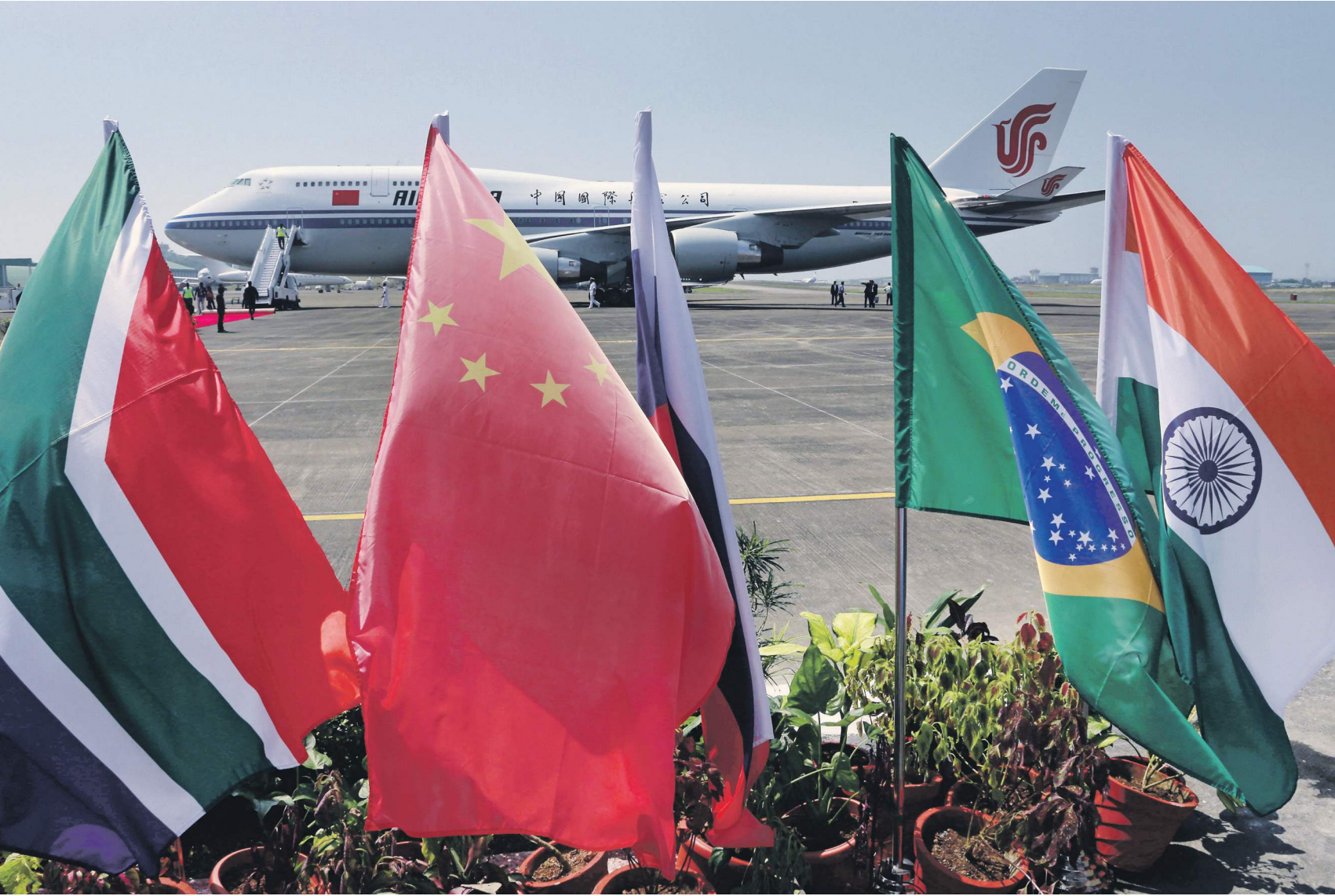
На пятерку стран БРИКС приходится примерно четверть мировой экономики