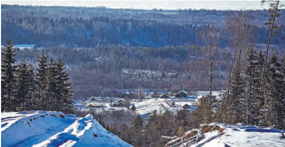
На месте трасс находились леса, поваленные смерчами.