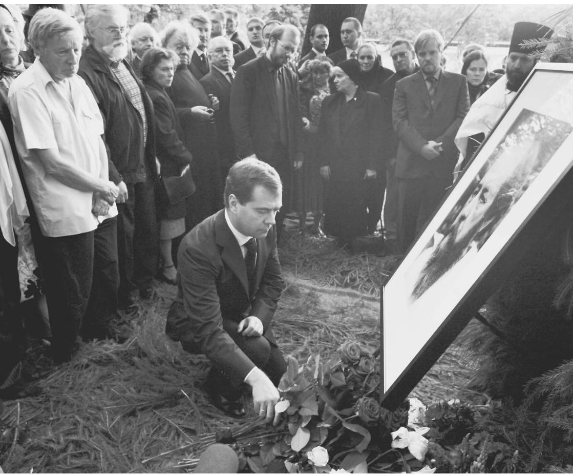
ДМИТРИЙ МЕДВЕДЕВ склонился перед могилой писателя с букетом бордовых роз

На старом кладбище Донского монастыря вчера похоронили Александра Солженицына. Пять лет назад он письменно обратился к Алексею II с просьбой похоронить его именно здесь: «По сердцу мне духовная, благоговейная и так неразрывно связанная с Патриархом Тихоном обстановка Донского монастыря». Просьба Александра Исаевича исполнена. → стр. 2