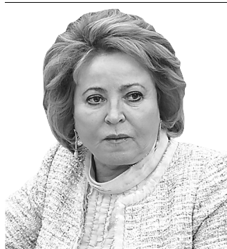
Валентина Матвиенко, председатель Совета Федерации РФ:

— Очевидно, что 31 декабря уже предновогодняя позитивная «новостка дня». И практически везде, кроме, пожалуй, предприятий с непрерывным производством, это почти нерабочий день, день корпоративных поздравлений и шампанского. Но раз это праздник семейный, значит, и подготовка к нему должна быть семейной. Поэтому я, конечно, за то, чтобы 31 декабря официально был выходным. И опыт этого года показал: власти во многих регионах приняли такое решение, а бизнесмены их поддержали. Поэтому на следующий год мы должны это предусмотреть. Но при этом общее количество выходных дней нужно оставить прежним.