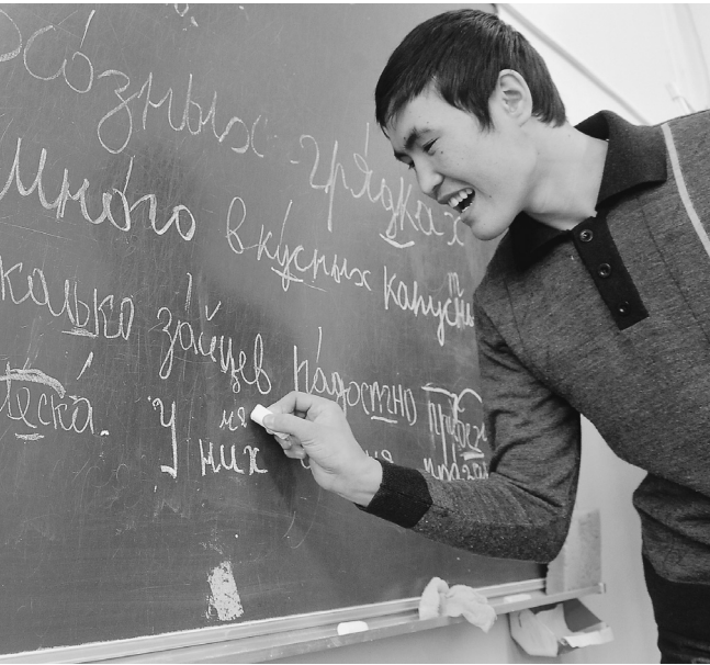
Язык — главный инструмент интеграции в общество

Одновременно РПЦ предлагает создать русские этнокультурные центры для поддержки русского народа.