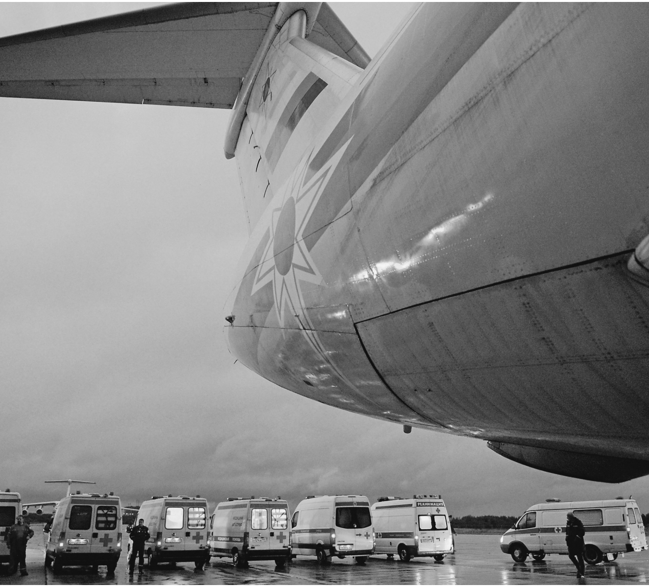
Летчики МЧС готовы к экстренным заданиям