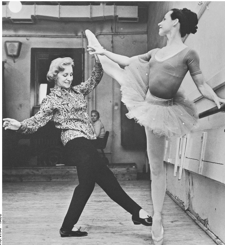
Ольга Лепешинская преподает в Будапеште. 1971 год