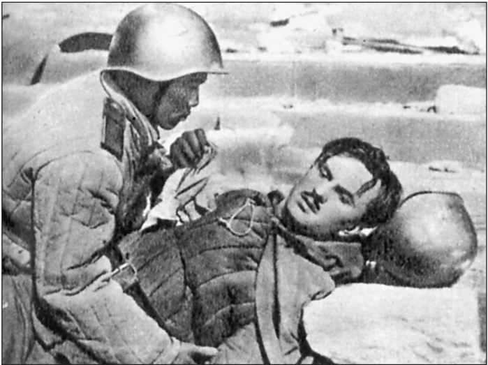
Кадр из истинно национального фильма «Падение Берлина»

Чего может желать в принципе всякая власть от кино? Едва ли банальной пропаганды и агитации в свою пользу. На это существуют СМИ вообще и информационно-политическое телевидение в частности. Телевидение в этом отношении давно стало важнейшим из СМИ. Оно по преимуществу инструмент в межпартийной борьбе. А вот кино по-прежнему остается