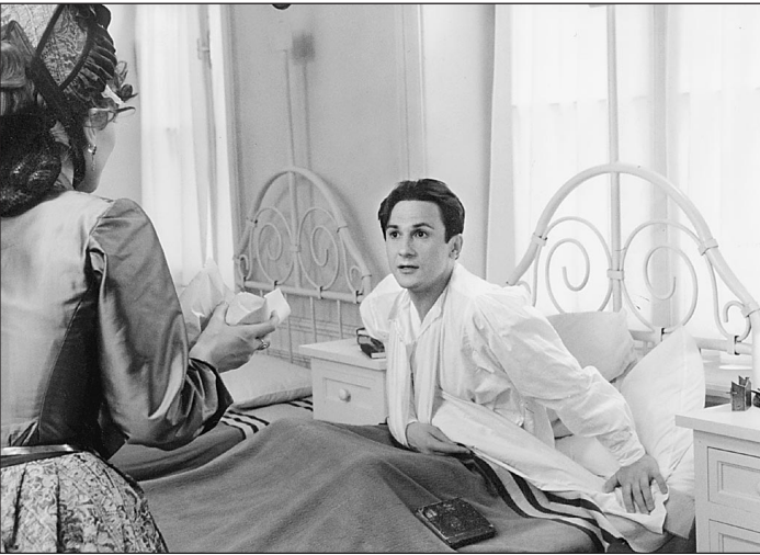
Кадр из фильма «Сибирский цирюльник», который, по новому законопроекту, нельзя считать национальным

В проекте расписано, как будут общественно-государственные органы проверять национальность кинопроизведения. Очень просто. Прежде всего продюсер должен быть гражданином России. Им же обязаны стать режиссер-постановщик, автор сценария и композитор. Про оператора ничего не сказано, стало быть, ему разрешено быть подданным другой державы, не исключая и другой сверхдержавы, так же как и художнику-постановщику, художнику по костюмам, актерам, осветителям. Но чтобы инородцы в этой группе риска не сильно зазнавались и нагтели, прописана общая норма — в ней должно быть «не более 30% лиц, не имеющих гражданства РФ».