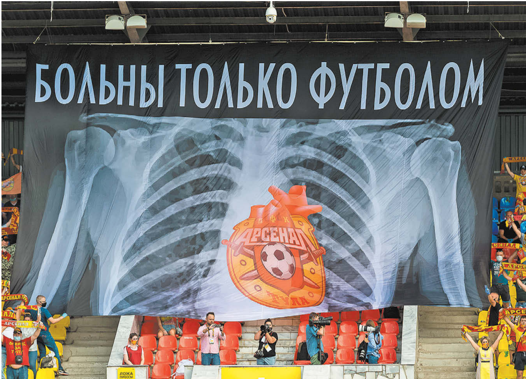
Суббота. Тула. «Арсенал» – «Спартак» – 2:3. Этот и другие матчи 23-го тура стали важными элементами в борьбе футбола с коронавирусом

Первый тур чемпионата России после карантина получился невероятно насыщенным и драматичным – коронавирус и футбол бьются не на жизнь, а на смерть