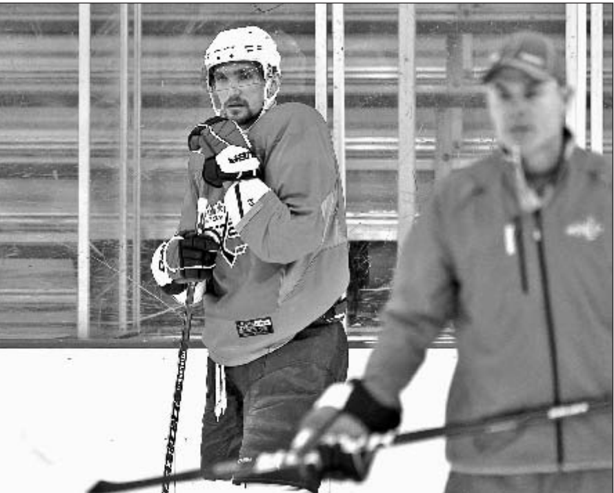
Главная звезда «Вашингтона» Александр ОВЕЧКИН и главный тренер команды Адам ОУТС.

- Не думаю, что подход как-то изменится. Понимаете, найти хороших игроков так трудно... Особенно нам в «Вашингтоне», потому что мы, благодаря успешной игре в регулярном сезоне, обычно выбираем ближе к концу драфта. Так что я готов идти куда угодно и брать любого игрока, откуда бы он ни был. Если он хороший хоккеист, я его возьму - и точка. А за Овечкина не боюсь. Он с нами всегда откровенен и сказал, что хочет играть в «Вашингтоне». - Ему исполняется 28, и не за горами то время, когда он, вполне возможно, начнет сбавлять. Не чувствуете, что у вас осталось не так уж и много сезонов на то, чтобы завоевать Кубок Стэнли? - Не знаю, не знаю. В НХЛ много игроков, продолжающих выступать на высочайшем уровне и в 40 лет. То, как хоккеисты тренируются и как за собой следят... Не думаю, что у нас в запасе такой уж и маленький срок. К тому же Ови выиграл «Харта», так что говорить о сдаче позиций рановато. - Евгений Кузнецов получил травму. Это вас не беспокоит? - У нас, к сожалению, информация не настолько полная, как хотелось бы. Стараемся узнать побольше. Говорили с ним сегодня, а до этого - пять дней назад. Знаем, что он не будет играть четыре - шесть недель. Окончание - стр. 8