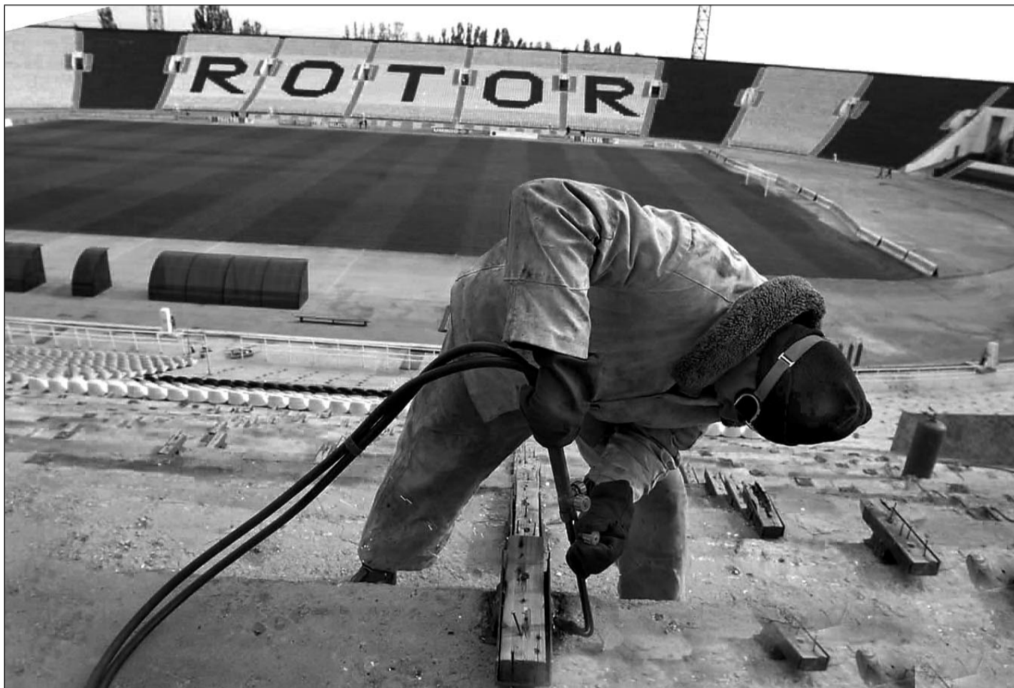
Вчера. Волгоград. Центральный стадион полностью готов к матчу Россия - Албания: последним штрихом стала установка столов в ложе прессы.

Необходимо учесть, что сборные обязаны выступать только в определенные дни, указанные в международном календаре. В этом году остался один такой день - 20 ноября.