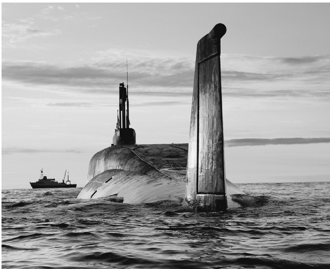
Экипаж «Юрия Долгорукого» может и не узнать, что с его борта ушла ракета

При этом для передачи координат целей и команды на пуск используют спутники связи «Ямал», работу которых обеспечивает «дочка» «Газпрома» ОАО «Газпром — космические системы». — Название автоматизированной системы управления является секретным. Сейчас она работает только на стратегическом ракетноносце «Юрий Долгорукий», и пока только с ракетами «Булава». В дальнейшем все остальные «Бореи» будут подключены к этой системе. Также ведутся работы, чтобы совместить новую АСУ с подводными лодками проекта 667 БДРМ, вооруженными ракетами «Синева». После этого система управления станет глобальной, — рассказал «Известиям» офицер ВМФ, знакомый с ситуацией. Сейчас координаты целей для стратегических ракет под-