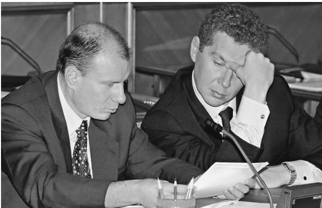
Владимир Потанин и Александр Мамут поделят новый суперактив пополам