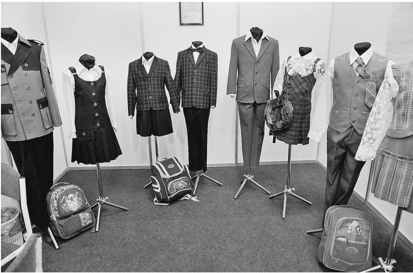
Школьная форма должна мобилизовать на учебу