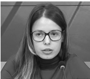
«Голос» «Наших» станет «провайдером» администрации президента