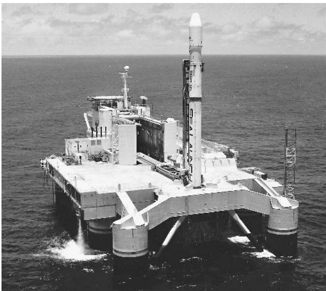
«Морской старт» остается космическими воротами

Дальнейшая судьба «Морского старта» оказалась под вопросом в начале этого года, когда Лопота предложил государству оказать содействие проекту, либо став