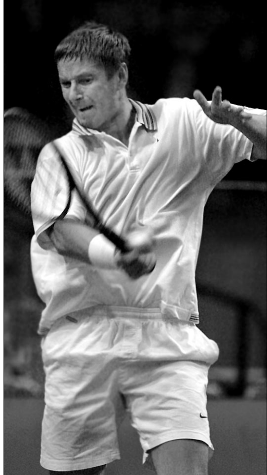
Вчера. Москва. Евгений КАФЕЛЬНИКОВ.

Впрочем, 2:0 - еще не победа. Три года назад в матче против Словакии россияне после первого дня имели такое же преимущество, но в итоге все решилось только в заключительной, пятой встрече. Шведы знамениты своими бойцовскими качествами. За всю историю своих выступлений в Кубке Дэвиса они 5 раз спасали матч, проигрывая 0:2. Поэтому Кафельникову и Сафину нужно постараться решить исход четвертьфинала уже сегодня, в парной комбинации. Тем более что усталость вчера они просто не испытали.