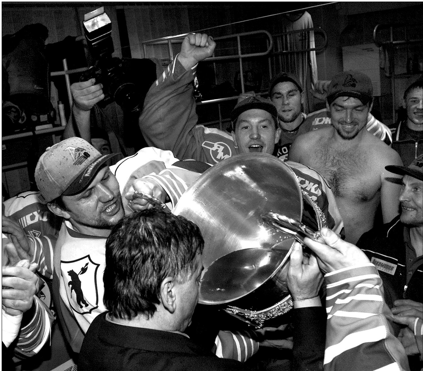
Вчера. Казань. Первый глоток шампанского из только что завоеванного чемпионского кубка делает наставник «Локомотива» Владимир ВУЙТЕК.

Это те, кто мечтает развивать свои достоинства, а не устранять чужие недостатки.