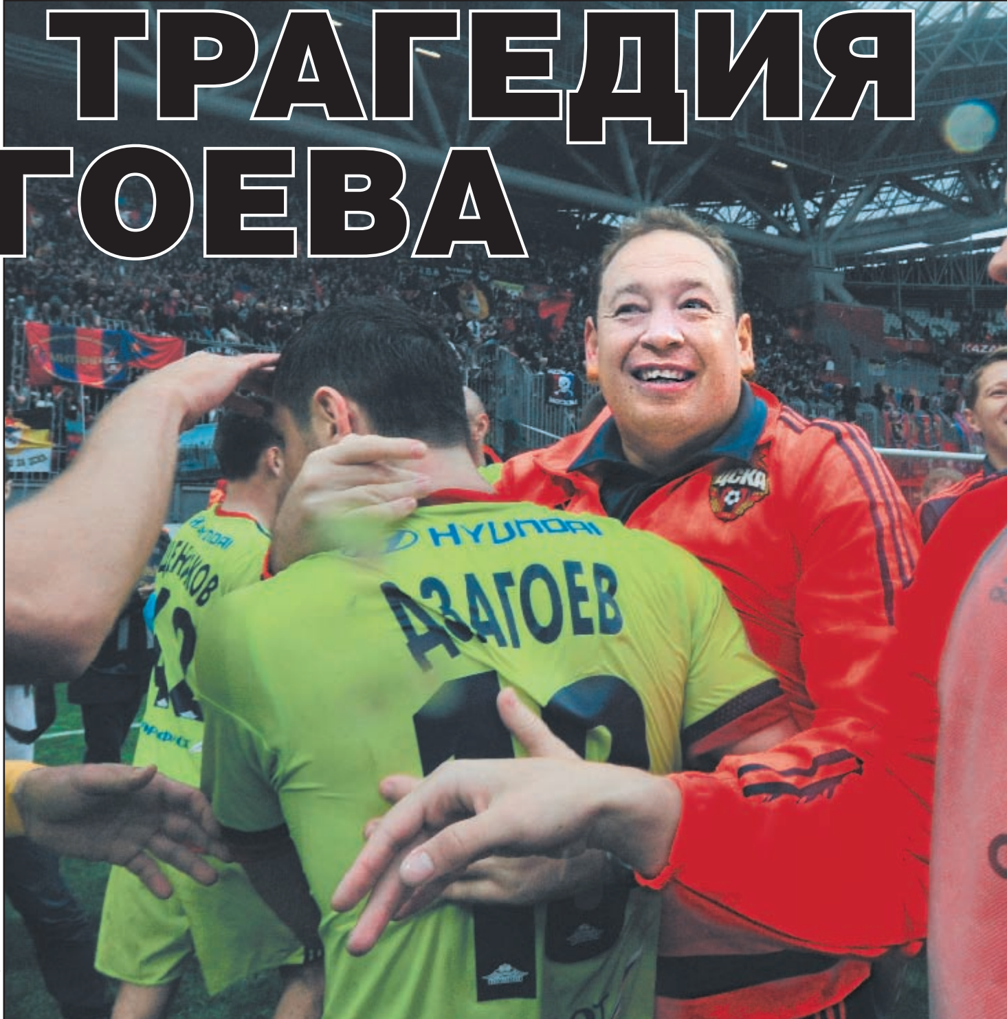
Суббота. Казань. «Рубин» - ЦСКА - 0:1. Только что команда Леонида СЛУЦКОГО стала чемпионом благодаря голу Алана ДЗАГОЕВА. Ни тренер, ни футболист еще не знают, что полузащитник пропустит чемпионат Европы из-за травмы...