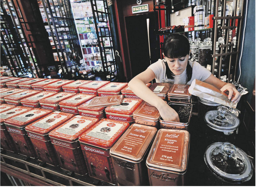
Максим Емелин / «Известия»