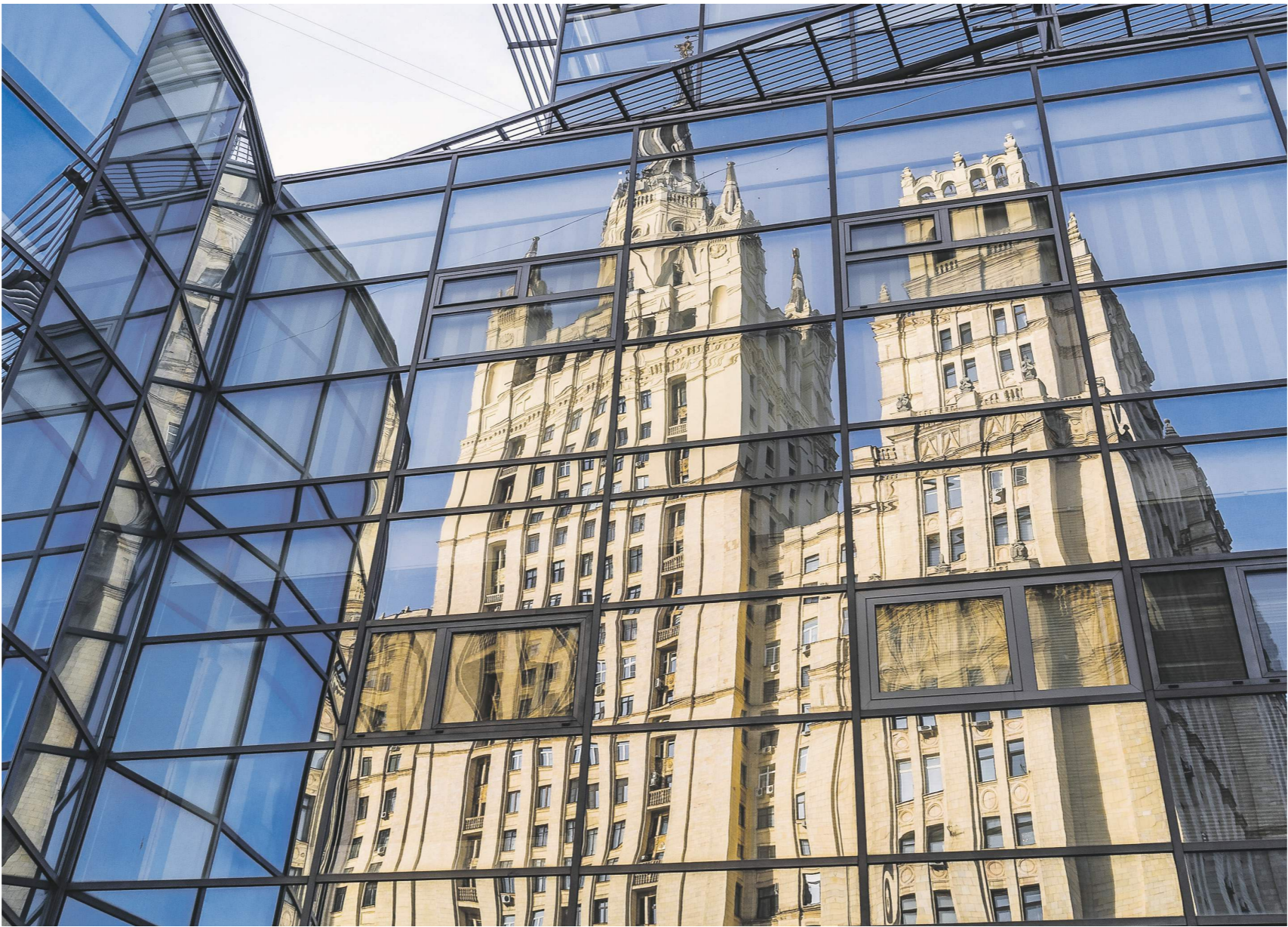
Константин Кошкин / «Известия»