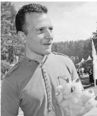
Экс-глава Росмолодежи зовет соратников в небольшое путешествие