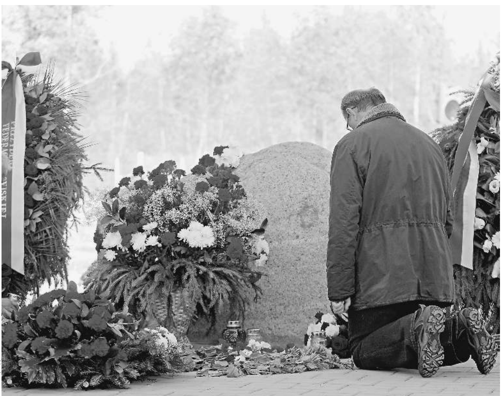
Польская скорбь простирается на территорию больше Красной площади