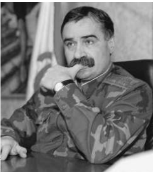
Генерал Аушев руководил республикой 9 лет