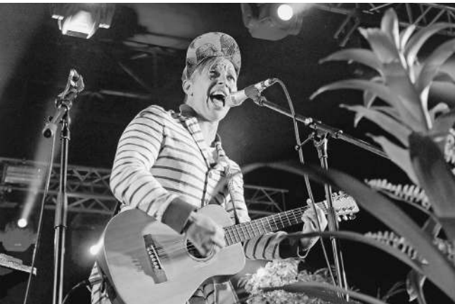
«Мумий Троль» уже год не может докричаться до Twitter

На начальных этапах существования компании было выгодно показать, насколько они «крутые» и что их сервисом пользуются первые лица государства, — говорит Носик. —