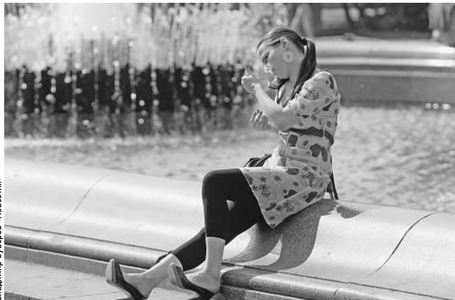
Для владельцев старых номеров связь может подешеветь

Тем временем Москва полностью перешла на одиннадцатизначный набор номера (8-код-номер), а остальные города-миллионники сделают это в ближайшее время. И, значит, еще одно преимущество «прямых» номеров — возможность дозвониться до городского телефона в семь цифр — уходит в прошлое. В 2008 году в России запретили предоставлять услуги сотовой связи по городским телефонным номерам. Операторы изменили условия договоров с пользователями «прямых» номеров — теперь все звонки с них переадресовываются на специаль-