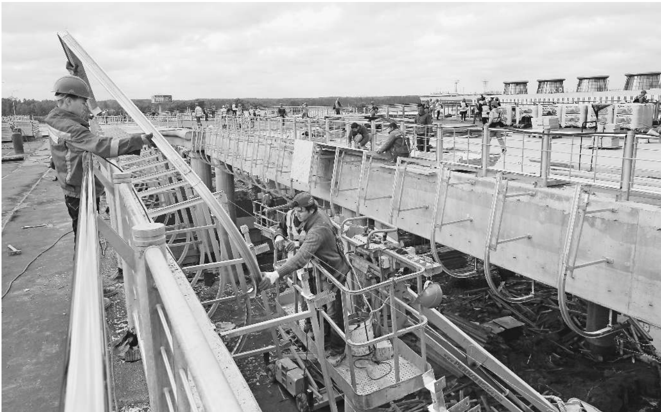
Идущая рядом стройка нового терминала тоже может снизить уровень безопасности