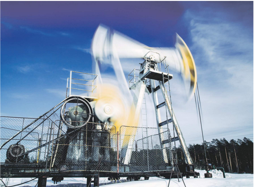
Алексей Андреев / ТАСС