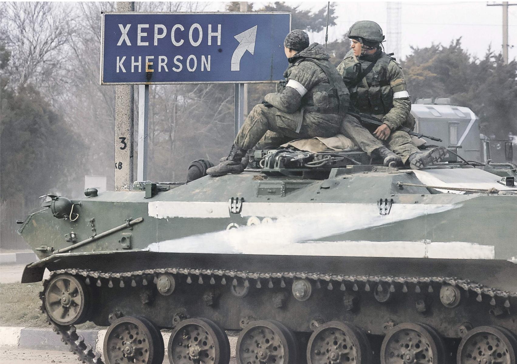
Сторей Матвеев / ТАСС